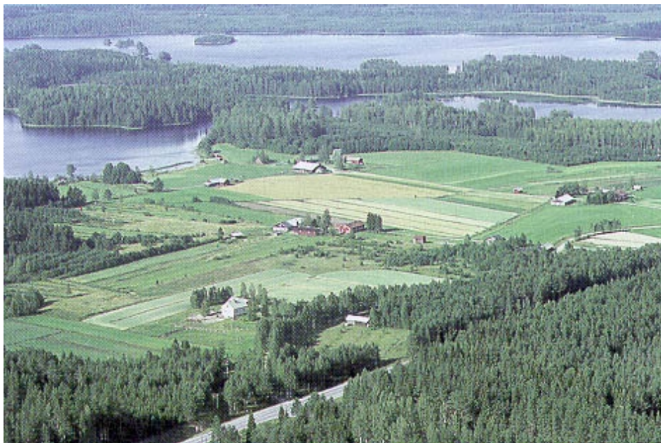
Kuva 1. Metsätalous on maatalouden rinnakkainen tuotantosuunta useimmissa maatalouksissa.

kundäaritehtävän, jossa tarkastellaan kannattavuuden lisäksi metsän merkitystä likvidin rahan lähteenä tai omistajan vapaaksi jäävän työpanoksen käyttäjänä. Kaiken kaikkiaan metsäomaisuus maatilalla on komplisoitu päätöstehtävä kuvattavaksi yleispätevällä mallilla.