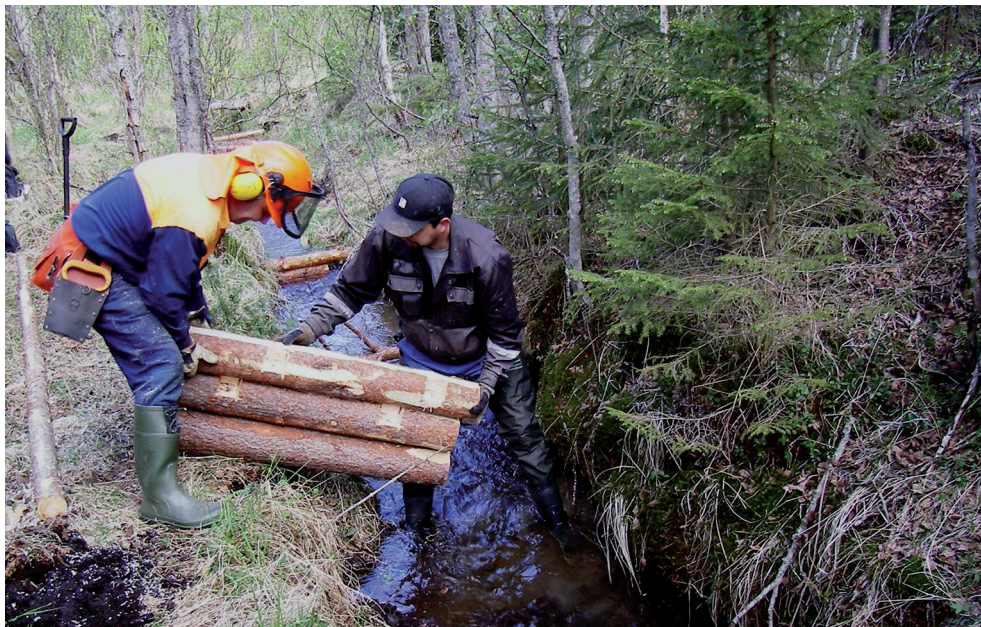
Kuva 3. Puurakenteiden asentamista. Liettyneissä metsäpuroissa rakenteiden tulee olla järeitä ja mitoitettu niin, että ne ainakin tulvavirtaamalla aikaan saavat hienon aineksen liikkumista.

Kunnostuksissa käytettyjä puurakenteita ovat esimerkiksi virranohjaimet ja erilaiset patorakenteet sekä kiintoaineen pidättämiseen ja irrottamiseen