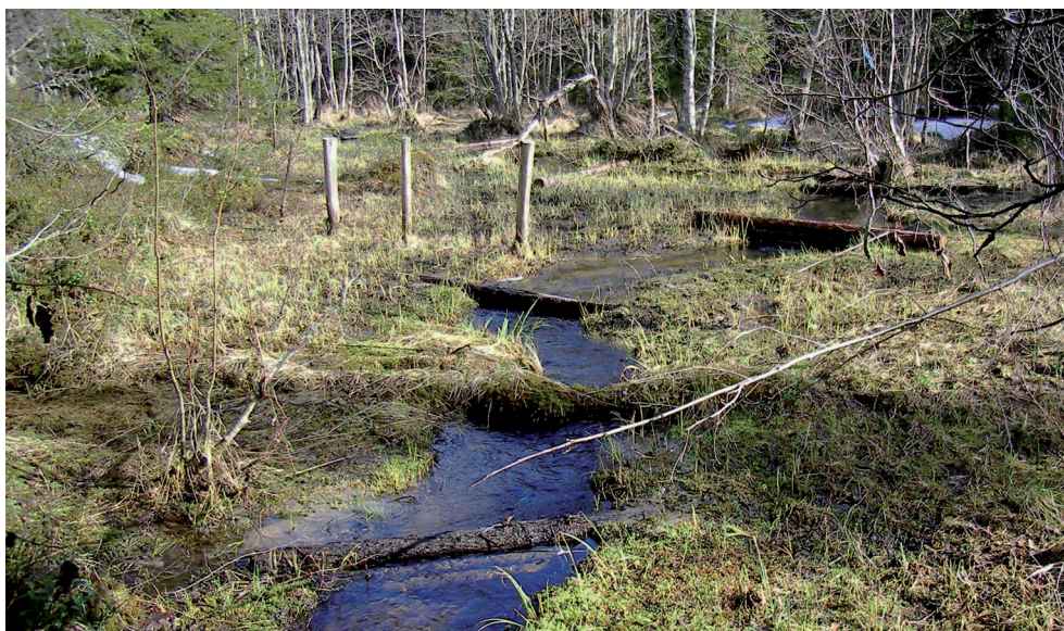
Kuva 4. Matalarantaisille virta-alueille sijoitetut patomaiset rakenteet aikaansaavat kiintoaineen siirtymistä puroista tulvasanteille.

soveltuvat rakenteet. Rakenteilla ei välttämättä tarvitse olla välitöntä vaikutusta vesiuomaan, vaan niitä voidaan sijoittaa myös uoman päälle ja tulvivalle maa-alueelle ohjamaan tulvaveden mukana kulkevaa kiintoainetta sivummalle uomasta. Rakenteiden sijoittelussa huomioidaan puron pituus- ja poikkileikkaus, virtaus- ja syvyysolosuhteet, tulvimisherkyys sekä pohjanlaatu. Pohjavesivaikutteiset purot ovat heikkoja tulvimaan, jolloin rakenteissa suositaan mieluummin uomaa muokkaavia ja hiekkaa sitovia kuin maalle tulvittavia rakenteita. Tehokkaimpia rakenteita kiintoaineen siirtämiseen ovat ns. alta-kaivajat (esim. poikkisuisteet), joiden alitse virtaus pakotetaan kokonaan tai osittain. Altakaivajien toimintaa on tutkittu myös laboratorio-olosuhteissa ja niiden aiheuttaman virtauksen on havaittu siirtävän tehokkaasti kerrostunutta sedimenttiä eteenpäin uomassa.