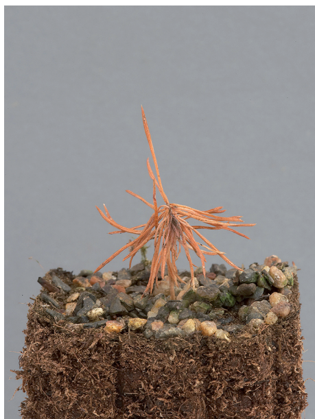
Kuva 3. S. conigenus tappama kuusen sirkkataimi.

sieni alentaa puiden kasvua, kun vuosikasvaimista osa kuolee (Halmschlager ym. 2000). Metsiköissä S. conigenus on myös yleinen seurannaistuhooja paleltumissa tai tuomiruosteen käyristämissä latvaversoissa (Kujala 1950, Halmschlager ym. 2000, Tian Fu ja Uotila 2002). Infektoituneitten siementen välityksellä sieni leviää sirkkataimiin aiheuttaen niiden sairastumisen ja kuoleman (kuva 3). Tartunnan saaneeseen taimeen kehittyy kuromapulloja, joissa kehittyvät kuromaitiöt levittävät tautia edelleen (Sutherland ym. 1981). Taimitarhoilla samoin kuin metsässä sieni tarttuu joko kasvin puutumattomiin osiin tai vauriokohtiin ja aiheuttaa latvan taipumisen tai korojen synnyn versoon (Lilja ym. 2005). Tyypillistä tälle sienelle on, että sairaat taimet eivät esiinny ryppäinä, vaan yksittäin laajemmalla alueella. Taudin leviäminen taimesta toiseen aiheuttaa kuitenkin enemmän tappioita kuin tavallinen taimipolte.