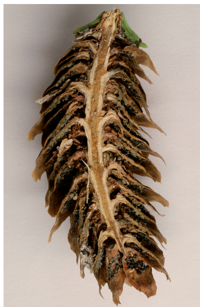
Kuva 1. Pitkittäissuunnassa halkaistu, kuusentuomiruosteen ( Thekopsora areolata ) infektoima käpy. Mustiksi kesän aikana muuttuvat itiöpesäkkeet kehittyvät käpysuomujen alapinnalle.

Havupuilla esiintyvä sieni Sirococcus conigenus (D.C.) P.F. Cannon & Minter tartuttaa sekä kasvussa olevia versoja että käpyjä. Käpyjen pintaan syntyy tummia kuromapulloja (kuva 2), joissa syntyvät kuromaitiöt levittävät tautia paitsi siemeniin myös ympäristön puihin (Sinclair ym. 1987). Metsässä