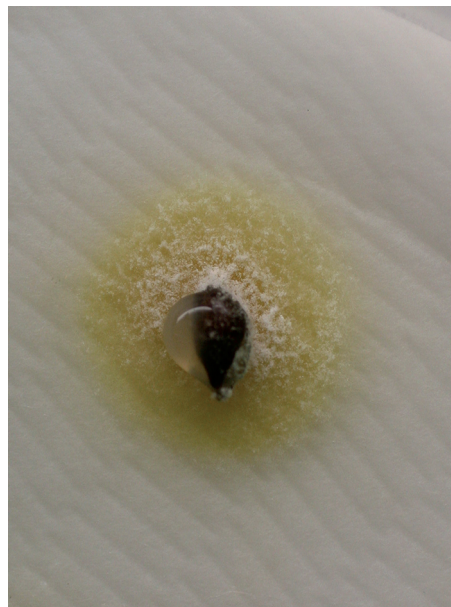
Kuva 5. Idätystestissä kuusen siemenen päälle on kasvanut limamaista bakteerimassaa. Siemenen päällä ja idätyspaperilla kasvaa lisäksi Penicillium -homesientä.

Sieni-itiöt itävät ja rihmastot kasvavat parhaiten lämpimässä (15–22 °C) ja kosteassa (RH 60–80%) (Sutherland ym. 2002). Siementen sienissä on kuitenkin lajeja, jotka viihtyvät alhaisissa lämpötiloissa. Eräät yleiset lajit, kuten harmaahome ( Botrytis cinerea Pers. ex Nocca & Balb.), itävät vielä 0 °C:n lämpötilassa, kun kosteutta on riittävästi (Petäistö