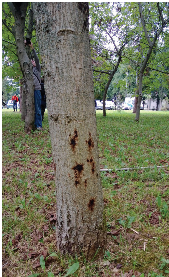
Kuva 2. Italiasta taimitarhalta taimen mukana siirtyneen Phytophthoran aiheuttamia laikkuja nuorehkoissa puisto- puussa Etelä-Suomessa.

Myös Phytophthora -mikrobeja pidetään yleisesti Suomea lämpimämpien ilmastojen tuhonaiheuttajina, joten niiden mahdollisesta kulkeutumisesta maahamme aiheutuvat tuhot saattavat lisääntyä ennalta arvaamattomasti, jos ilmasto lämpenee ennakoitusti (kuva 2). Sama koskee myös esimerkiksi hollanninjalavatautia, jota rajoittaa sitä kantavien vektorihyönteisten puuttuminen Suomenlahden pohjoispuolelta.