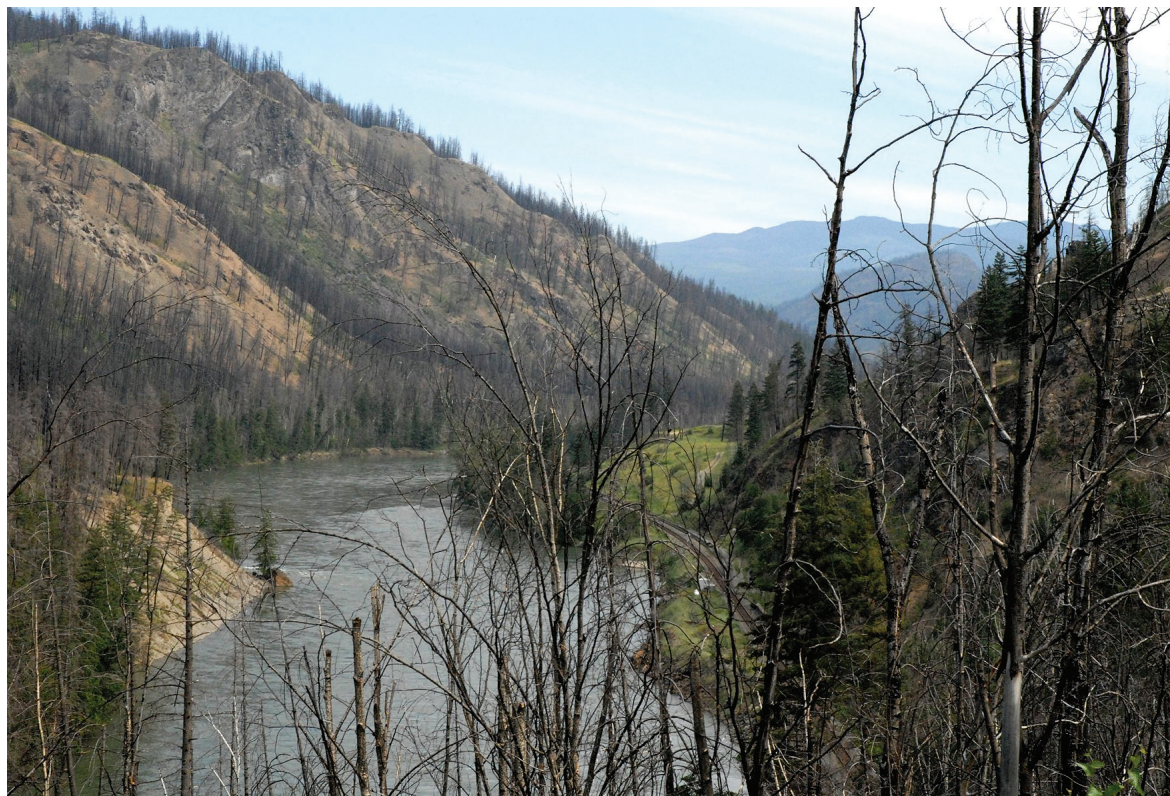
Kuva 1. Vuoristonilurin tuhoamaa mäntymetsää British Columbiassa, Länsi-Kanadassa.

ovat pysyneet maastamme pois. Näistä merkittävien on hollanninjalavatautia aiheuttava Ophiostoma novo-ulmi -sieni.