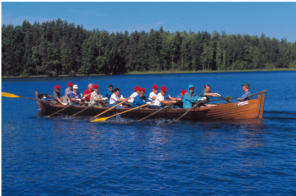
Kuva 1. Kirkkovenesoutu on ulkomaalaisiakin houkutteleva ohjelmapalvelu, joka pohjautuu suomalaisiin perinteisiin. Yrittäjätverkosto voi tarjota paketin, johon kuuluu kirkkovenesoudun lisäksi mm. majoitus, ruokailu, muita ohjelmapalveluja sekä matkat.

mailla. Massaturismin sijaan etsitään yksilöidymiä tuotteita, aitoja lomakohteita, luonnonläheistä lomaa, ohjelmapalveluja, teemamatkailua, perhematkailua ja luontoharrastuksia.