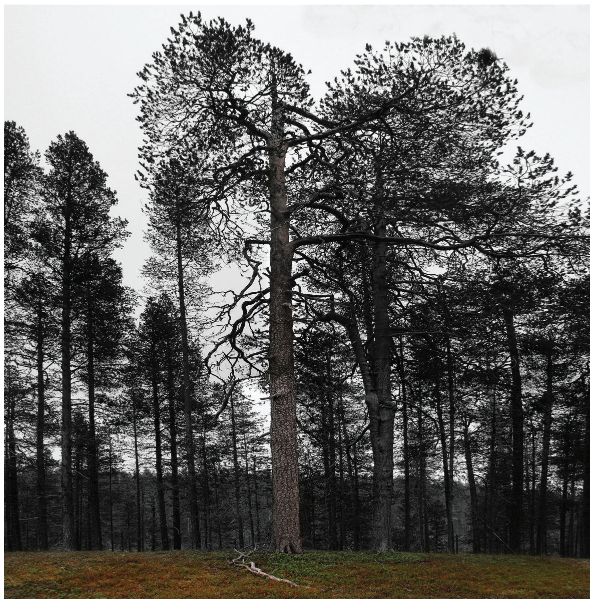
Kuva 1. Monilla kulttuureilla on myytti suuresta puusta tai patsaasta kosmosta kannattelevana rakenteena. Kalevalaiselle Sammolle on annettu myös tämä selitys. Kuvan aihipetäjä sijaitsee Muoniossa mytologisen saivo-järven rannalla. (Kuva ja kuvankäsittely Mikko Jokinen)

joitutetussa perinteessämme. Havainto tulee tuskin yllätyksenä monellekaan kun tarkastelun kohteena ovat kaski- ja erätaloudessa eläneet suomalaiset, karjalaiset, saamelaiset ja Siperian suomensukuiset kansat. Minnekä muuallekaan kuin luontoon nämä luonnossa ja luonnosta eläneet kansat olisivat si-