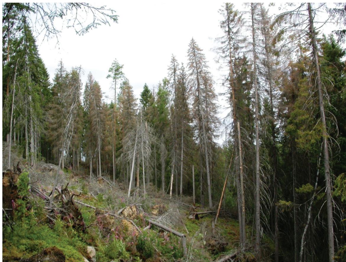
Kuva 1. Kirjanpainajan tappamia ja oireilevia kuusia Ruokolahdella.

eteläpuolella menestyvien tuholaiden levinneisyysalueiden muutoksille kasvaa. Ongelmia meillä tulevat aiheuttamaan edellisten tuholaiden lisäksi mm. havununna ( Lymantria monacha L.), mänty-yökkönen ( Panolis flammea Den. & Schiff.) ja männynversokääriäinen ( Rhyacionia buoliana Schiffermüller).