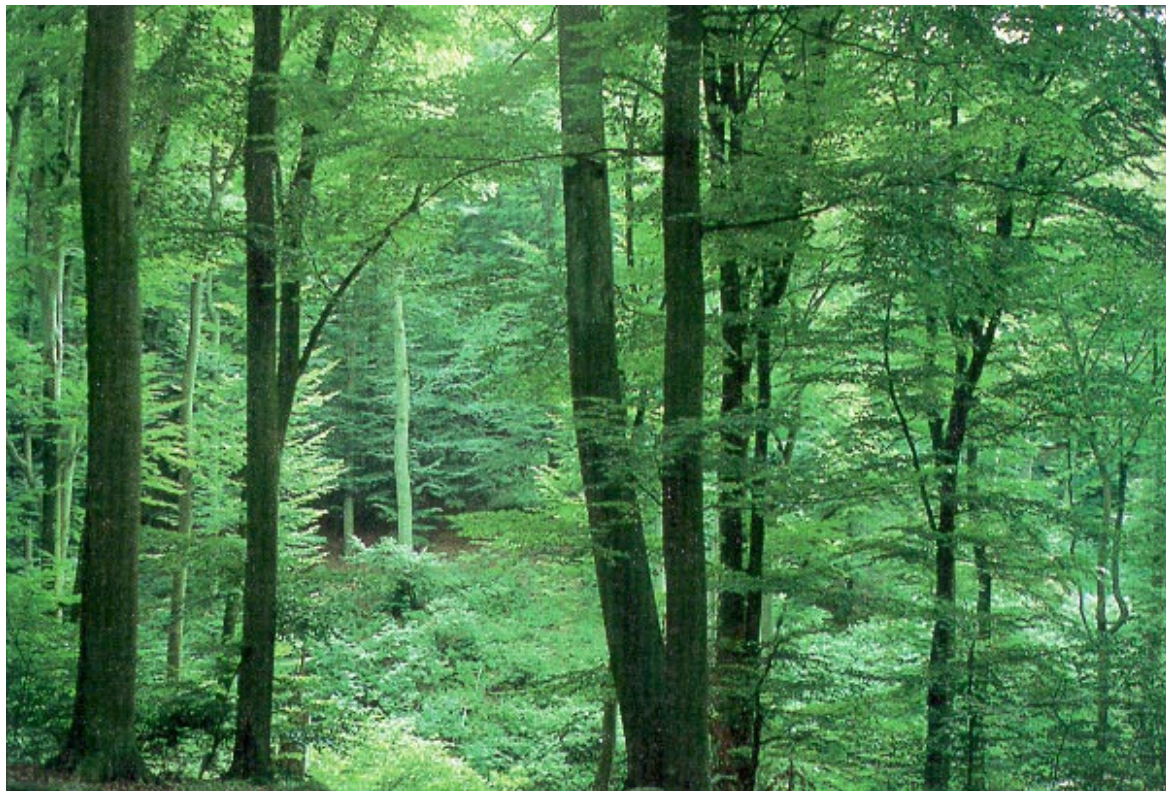
Kuva 2. Metsämaisemaa Suomen rannikkoseuduilta v. 2075? Kenties, mutta tämä vihreä pyökkimetsä on kuitenkin Saksassa Mosel-joen varrella.

Ilmaston nopeasta muutoksesta ei ole viimeisten selvitysten mukaan ennustettu olevan vakavia seu-