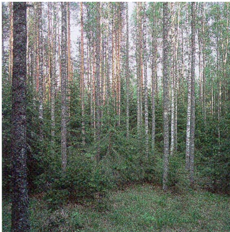
Kuva 3. Kylvään uudistettu metsä, jossa yhdistyvät hyvän metsänhoidon vaatimukset.

Biosentrinen metsäluonnon suojelu on tähän mennessä keskittynyt pääosin taloudellisesti toisarvoisiin kohteisiin, kuten lehtoihin ja puronvarsiin, jalojen lehtipuiden esiintymiin, pihlaja- ja katajavii-dakkoihin jne. Vain vanhojen metsien suojelussa on syntynyt todellisia ristiriitoja luonnon suojelijoiden ja metsän kasvattajien välillä. Yleisesti ottaen ovat väkivaltaiset törmäykset sentään olleet harvinaisia, kun ottaa huomioon vaarallisten ja tu-lehtuneiden tilanteiden lukuisuuden.