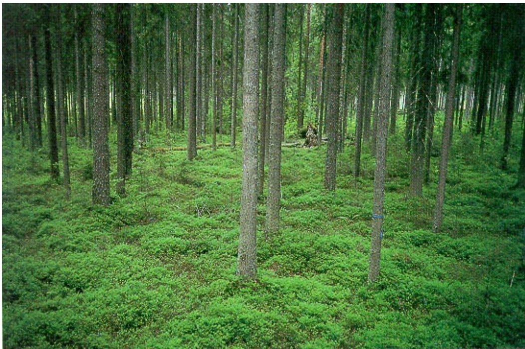
Kuva 2. Tyypillistä läntisen tutkimuspaikkakunnan puustoa erällä koeruudulla. Koeruutu tullaan käsittelemään uusimuotoisella avohakkuulla.

sekä luontaisen taimettumisen käynnistymistä ja viljelytaimien eloonjääntiä.