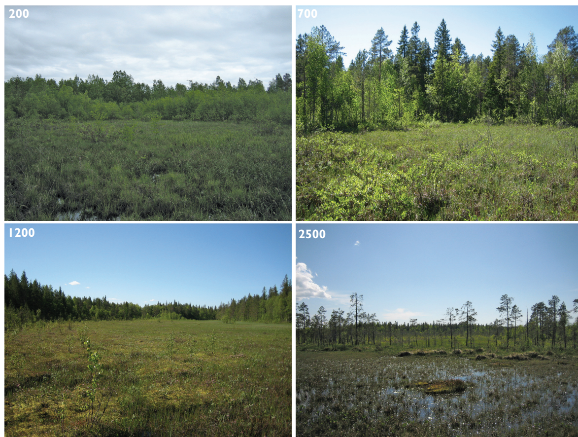
Kuva 3. Primaarisuknessiogradientti. Tutkimuskohteenamme oli seitsemään eri ikävaiheeseen kuuluvien soiden suknessiosarja merenrantaniitystä ombrotrofiseen suohon (n. 2500 vuotta) Siikajoen maankohoamisrannikolla Pohjois-Pohjanmaalla. Kuvissa ne ikävaiheet, joilla jo esiintyy rahkasammalia: 200, 700, 1200 ja 2500 vuotta maankohoamisen jälkeen. (Kuvat Maija Aarva).

Päinvastoin kuin odotimme, vanhimmilla karuimilla soilla aktiivinen metaanin hapetus ei lisännyt typensidontaa, vaikka metaania tuotettiin ja sitä hapetettiin kaikissa vaiheissa. Fosforin puutteen lisäksi selityksenä voi olla, että vanhat suknessiovaiheet ovat mätäsvaltaisia ja kuivempia, jolloin sammalkerroksen happipitoisuus voi olla liian suuri tehokkaalle typensidonnalle. Sen sijaan muut typensitojat, kuten sinibakteerit, olivat aktiivisia vanhemmillakin soilla. Niiden karuissa oloissa hitaasti kasvavien sammalten biomassan tyypestä suhteellisesti suurin osuus, jopa yli puolet, oli peräisin ilmakehästä sidotusta tyypestä.