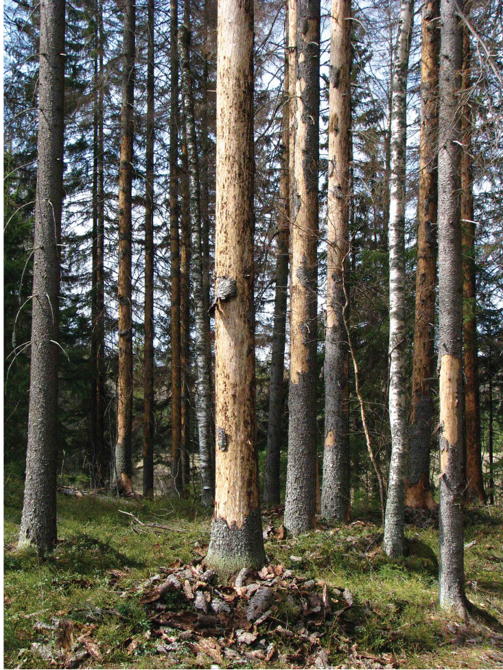
Kuva 1. Kirjanpajajan edellisenä kesänä tappamia puita kesäkuun alussa. Talvella hangelle varisseet kuoret ovat rungon tyvellä kuohkeana kasana, ja rungoilla on edelleen jäljellä ruskeaa purua kirjanpajajan käytävistä. Seuraavana kesänä purut ovat huuhtoutuneet pois, rungon sävy on muuttunut harmahtavaksi, ja tyvellä oleva kuorikasa on edellisen talven hangen tiivistämä.

palemäärä, kirjanpajajan tappamien puiden osuus mittausjaksolla kuolleista puista, kirjanpajajan tappamien puiden kuolleisuuden ajoittuminen eri vuosina kuolleiden puiden kappalemäärien perusteella sekä kirjanpajajapuiden tilavuus hehtaaria kohti. Kuusten tilavuus laskettiin Laasasenahon (1982) rinnankorkeuslähimittaan ja pituuteen perustuvalta tilavuusyhtälöllä. Pituuskäyrä puille laskettiin Näslundin yhtälön ja Rörstrandin alueelta mitatun pituuskoepuuaineiston avulla (ks. seuraava luku).