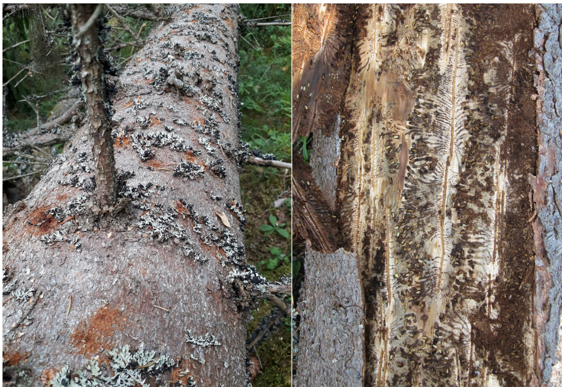
Kuva 1. Vasemmalla tuulenskaatama kuusi, jonka kimppuun kirjanpainajat ovat hyökänneet. Purukasat paljastavat, mistä aikuiset kuoriaiset ovat kaivautuneet rungon sisään lisääntymään. Oikealla elämää kaarnan alla: kirjanpainajan syömäjälkeä ja siitä erkanevia toukkakäyviä toukkineen.

Kun tuuli kaataa ison määrän kuusia, kirjanpainajat pystyvät lisääntymään näissä rungoissa ja sitä kautta kasvattamaan lukumääränsä niin suureksi, että myös terveiden puiden tappaminen onnistuu. Tämän jälkeen – jos sääolosuhteet ovat suotuisat – ne voivat itse ylläpitää tuhosykliään, koska niitä on tarpeeksi suuri määrä voittamaan myös terveiden puiden pihkapuolustuksen. Sääolosuhteiden vaikutus on Suomessa onneksi tässä suhteessa metsänomistajalle suotuisa: esimerkiksi vuoden 2017 kaltainen kylmä ja sateinen kesä katkaisi tehokkaasti kirjanpainajien parveilun. Tämänkaltaiset sääolosuhteet rajoittavat kannan kasvua riippumatta kannan senhetkisestä tasosta. Laaja-alaisten tuhojen syntyminen vaatisi suurten myrskytuhojen (vrt. esim. Gudrun (Ruotsi) 2005 tai Kyrill (Keski-Eurooppa) 2007) lisäksi myös useamman peräkkäisen sellaisen vuoden, jona sääolosuhteet olisivat kirjanpainajalle suotuisat: kuumaa ja vähäsateista. Tuulituhojen roolia kirjanpainajatuhojen laukaisevana tekijänä kylmä sää ei silti poista: syystalvellakin kaatuneet