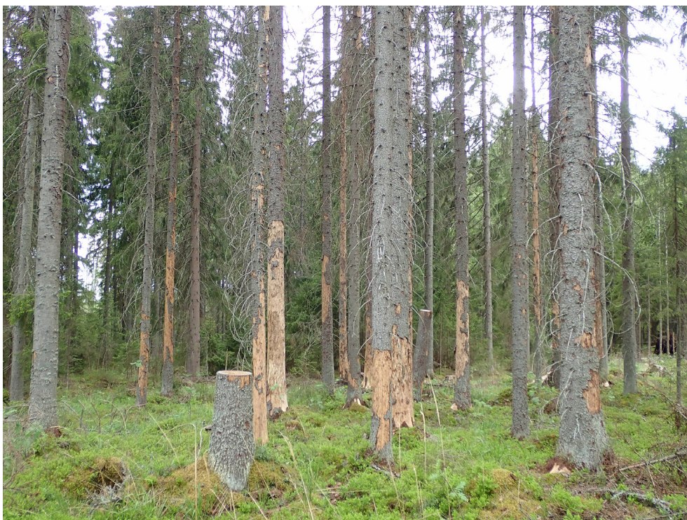
Kuva 2. Tyypillinen kirjanpainajatuho: varttuneita kuolleita kuusia, hyvin pienessä ryhmässä. Rungot, joista kaarna on irronnut ja jotka ovat jo kuolleet, eivät muodosta tuhoriskiä: ne voi jättää metsään lahoppuuta muodostamaan.

Toinen asia, josta etenkin Suomessa puhutaan paljon, on jatkuvan kasvatuksen ja jaksollisen kasvatuksen mahdolliset erot kestävyudessa hyönteistuhoja vastaan. Tutkimustietoa aiheesta on todella niukasti, mutta melko yleinen käsitys on, että eri-ikäisrakenteiset ja sekapuustoiset metsiköt kestäisivät metsätuhoja paremmin kuin tasarakenteiset, yhden puulajin metsiköt. Poikkeuksena ovat ikärakenteesta riippumatta sellaiset kuusivaltaiset metsät, joita vaivaa juurikäpää. Oletus jatkuvan kasvatuksen metsiköiden pienemmästä herkkyydestä kirjanpainajatuhoille perustuu siihen, että kirjanpainajalle soveltuvia isäntäpuita (varttuvat tai varttuneet kuuset) on pinta-alaa kohti vähem-