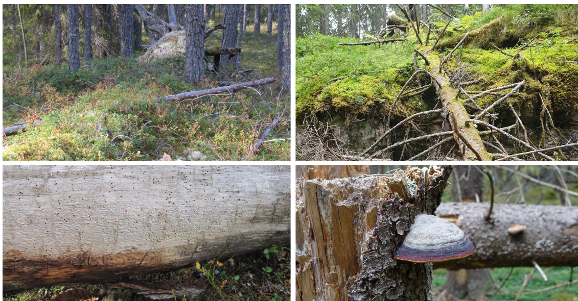
Kuva 3. Eriasteisesti lahonneesta puusta hyötyvät niin hyönteis-, sieni- kuin kasvilajitkin.

Lopuksi muistutamme, että puiden kuoleminen on ainoa tie luonnon monimuotoisuudelle arvokkaan lahoppuun syntyyn. Puiden kuoleminen on osa normaalia metsien dynamiikkaa, jota ilman metsä ei eläisi. Tuhosta puhutaan vasta, kun ilmiölle laitetaan hintalappu ja kun se on ihmisvinkkelistä katsoen tarpeeksi laaja-alainen ja merkittävä, tai kun sen koetaan alentavan metsän esteettistä arvoa. Jos ajaisimme metsiemme monimuotoisuuden alas esimerkiksi riisumalla ne lahoppuusta, aiheuttaisimme niiden toimintakyvylle vähintään yhtä vakavia ongelmia kuin ilmastonmuutos. Kun metsä on monimuotoinen esimerkiksi maaperän eliöstöltään, hyönteis- ja sienilajistoltaan sekä puulajistoltaan, se kestää paremmin niin äkillisiä tuhoja kuin ilmastonmuutoksen mukanaan tuomia pidemmän ajan muutoksia. Tämä monimuotoisuus vaatii sitä, että metsissä on elävien puiden lisäksi myös jatkumo kuolleita ja jo eriasteisesti lahonneita puita (Kuva 3).