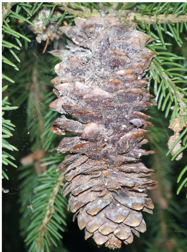
Kuva 1. Kuusen tuomiruosteen helmi-itiöpesäkkeitä kuusen käpysuomuilla.

sijainneista tai maahan varisseista sairaista kävyistä. Kävyistä karistettiin itiöitä vesi- ja mallasagarille. Maljoja kasvatettiin 9 eri lämpötilassa kasvatus- tai olosuhdekaapissa. Kasvatustilapöytä olivat 6 °C, 9 °C, 12 °C, 15 °C, 18 °C, 21 °C, 24 °C, 27 °C ja 30 °C. Alin lämpötiloista vastasi lämpötilaa, jolloin terminen kasvukausi alkaa keväällä. Korkein lämpötila vastasi kesähelteen lämpötilaa, joka saattaisi olla tappava itiöille estäen itämisen. Maljoja kasvatettiin 2, 6 ja 24 tuntia, jonka jälkeen itiöiden itävyys laskettiin 10:stä satunnaisesti valitusta kohdasta agarin pinnalta valomikroskooppilla. Itiöiden itävyyttä mallinnettiin agaralustan, lämpötilan ja itiöalkuperän suhteen erikseen 6 ja 24 tunnin idätyksen jälkeen SAS-ohjelmiston glimmix-proseduurilla. Mallissa itävyys oli jatkuva muuttuja, joka sai arvoja 0–1 (tai 0 % – 100 %) betajakaumalla. Itiöalkuperä ja agaralusta toimivat itsenäisistä muuttujista faktorimuuttujina ja lämpötila jatkuvana muuttujana. Lämpötilan vaihtelua kuvattiin toisen asteen yhtälöllä. Kiinteän vaikutuksen testillä selvitettiin eri muuttujien ja niiden yhdysvaikutusten vaikutusta itiöiden itämiseen. Paras itämistä kuvaava malli oli muotoa: